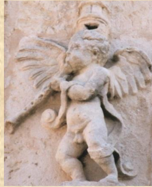
Àngels músics. Façana renaixentista de l'Església de Sant Vicent Màrtir. Guadassuar (València)